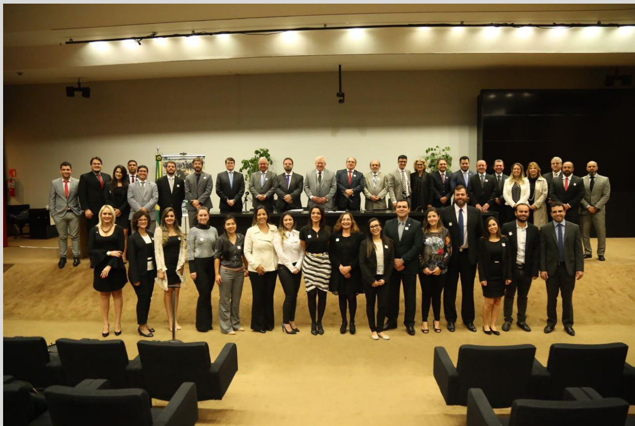
Auditório Nereu Ramos - Câmara Federal

Uma Associação com a visão dos franqueados